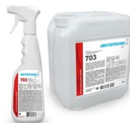
ИНТЕРХИМ 703 Средство регулярной очистки поверхностей в санитарных помещениях, с защитным эффектом